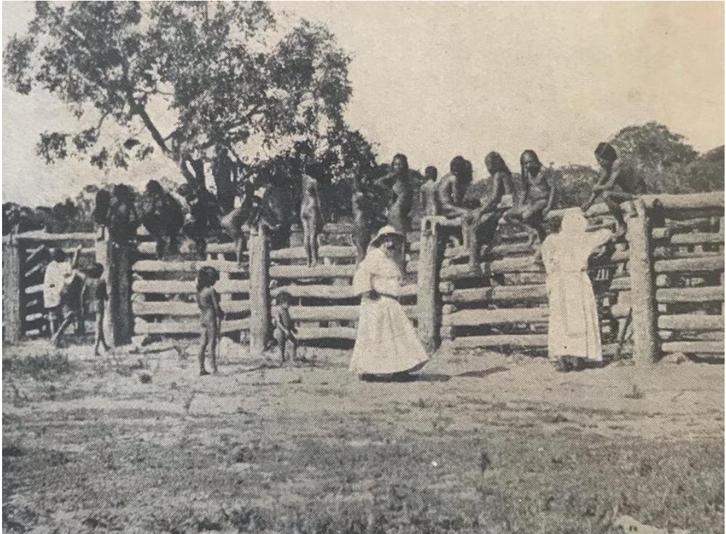
Figura 1 – Indígenas Kayapó observam gado bovino em curral da missão dominicana em Conceição do Araguaia, primeiras décadas do século XX.

predominância do cerrado – o “campo”, nas palavras de Coudreau –, com alguns “cantões arborizados” e “as montanhas” (Coudreau, 1897, p. 209). Numa clara alusão a esse bioma, o etnônimo Irã amrayré significa “aqueles que caminham em campos limpos” (Gordon, 2006; Turner, 1992) (Figura 1).