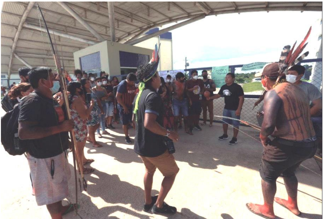
Figura 2 – Indígenas reivindicam melhores condições de acesso e de permanência na Unifesspa, Marabá, Pará, 2022.

(5°21'57.77"S | 49°1'25.16"O). 📍